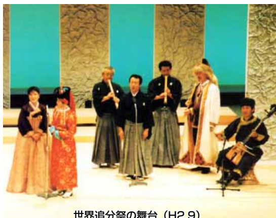
世界追分祭の舞台 (H2.9)

文化センターが落成して収容人数がかなり増えたにもかかわらず、この頃の大会は、毎回、立錫の余地もないほどの聴衆であふれました。そのような大会の盛り上がり背景に昭和五十五年以降、地方予選制が導入され、六十一年からは江差町の冬のメインイベントである「たば風の祭典」の一環として追分の勉強会である江差追分セミナーも始まりました。