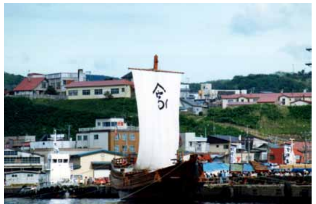
江差に入港した辰悦丸 (S61.6)

した出店や、高校生総出の踊り行列、仮設舞台での数々の郷土芸能、それに時ならぬ祭礼の山車まで練り出して、町は以後約一週間、出港の日まで空前の人出で賑わったのです。