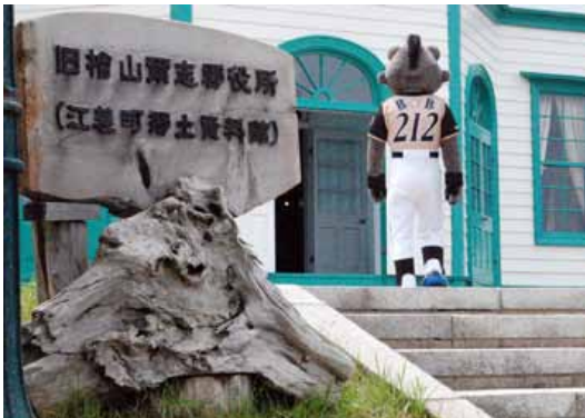
旧檜山爾志郡役所