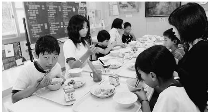
いかと野菜のオイスターソースいためを食べる子どもたち。

6月13日、「すずし小型いか釣り部会」から新鮮ないかの提供を受け、一斉に「いか給食の日」が設けられました。この取り組みは、食育と地産地消推進の一環として市教育委員会が行うもの。特産品の「大浜大豆」「ブロッコリー」など、地元産食材を使った給食日を毎月設け、食への関心を持ってもらうことを目的としています。この日は、市内全小中学校の給食でいかを使った料理が用意され、新鮮ないかをおいしそうに食べる姿が見られました。