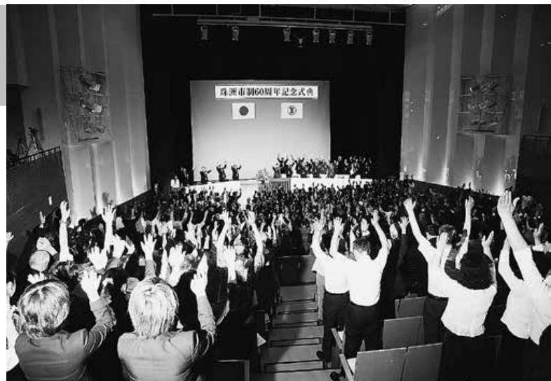
平蔵県議会議員の発声で万歳三唱をする出席者