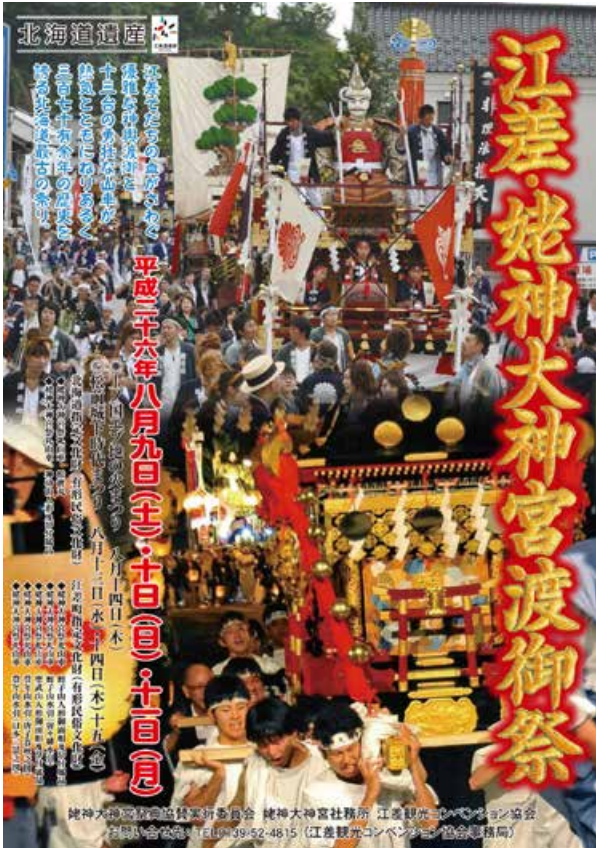
◎ 姥神大神宮祭典協賛実行委員会事務局 (江差観光コンベンション協会事務局 ☎52-4815)