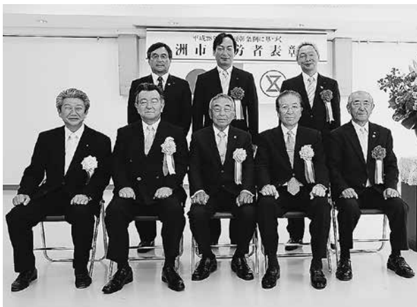
表彰を受けられたみなさんとの記念写真