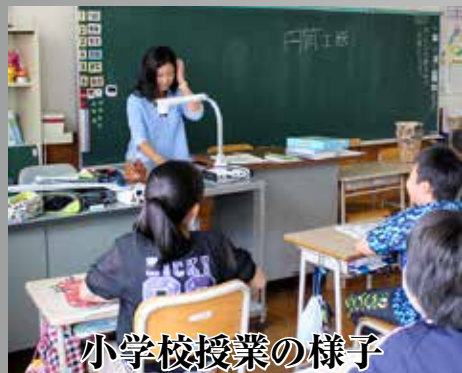
小学校授業の様子