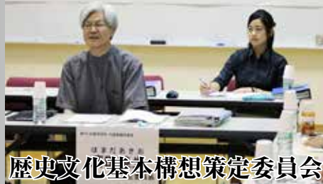
歴史文化基本構想策定委員会