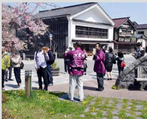
町内施設見学会の様子

今回は、町で作成したバーチャルリアリ ティについてご紹介したいと思います。昨 年の4月に町が日本遺産に認定され、江戸 時代の江差の繁栄の様子を町民や観光客に 見て楽しんでいただけるように、最新のCG (コンピュータグラフィック)を使って、江 戸時代の風景を再現しました。こちらはお 手持ちのスマホやタブレットから、お楽し み頂けます。