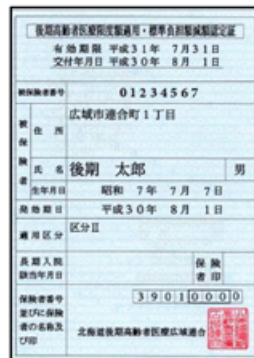
※新しい減額認定証は水色です。