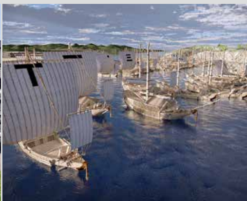
バーチャルリアリティで再現した北前船