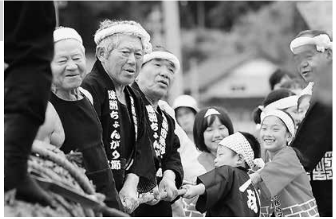
「木遣り」再現の様子

また、神木などを大人数で唄を歌いながら運ぶ「木遣り」が再現され、会場のみなさんは、用意された約2トンの大木を引き、当時の作業を体験しました。