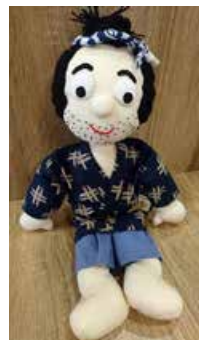
繁次郎ぬいぐるみ